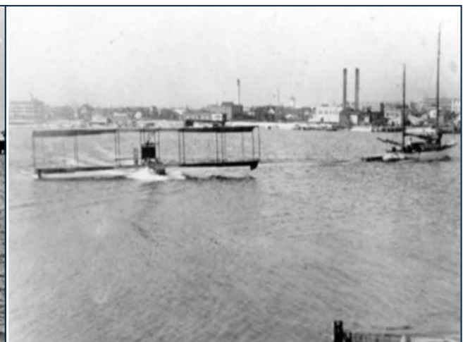
Así fue el primer vuelo comercial del mundo